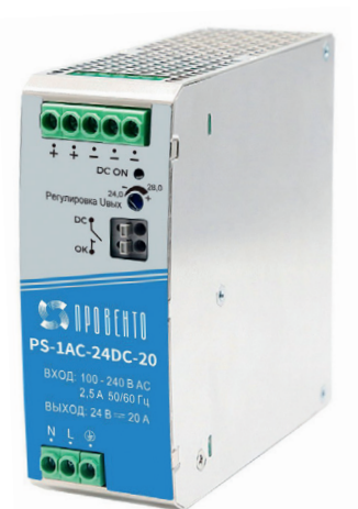
Источник питания однофазный, 24 В DC, 20 А