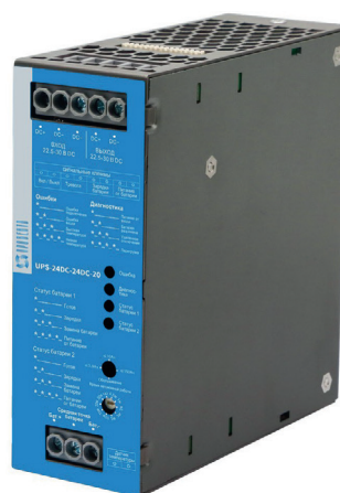
Источник бесперебойного питания, 24 В DC, 20 А