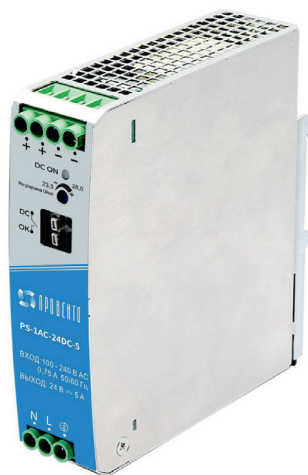
Источник питания однофазный, 24 В DC, 5 А