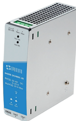
Диодный модуль, 24..48 В DC, 20 А